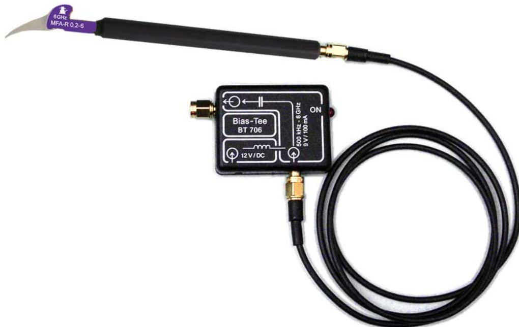
Bias-Tee BT 706 mit Nahfeldmikrosonde MFA-R 0,2-6