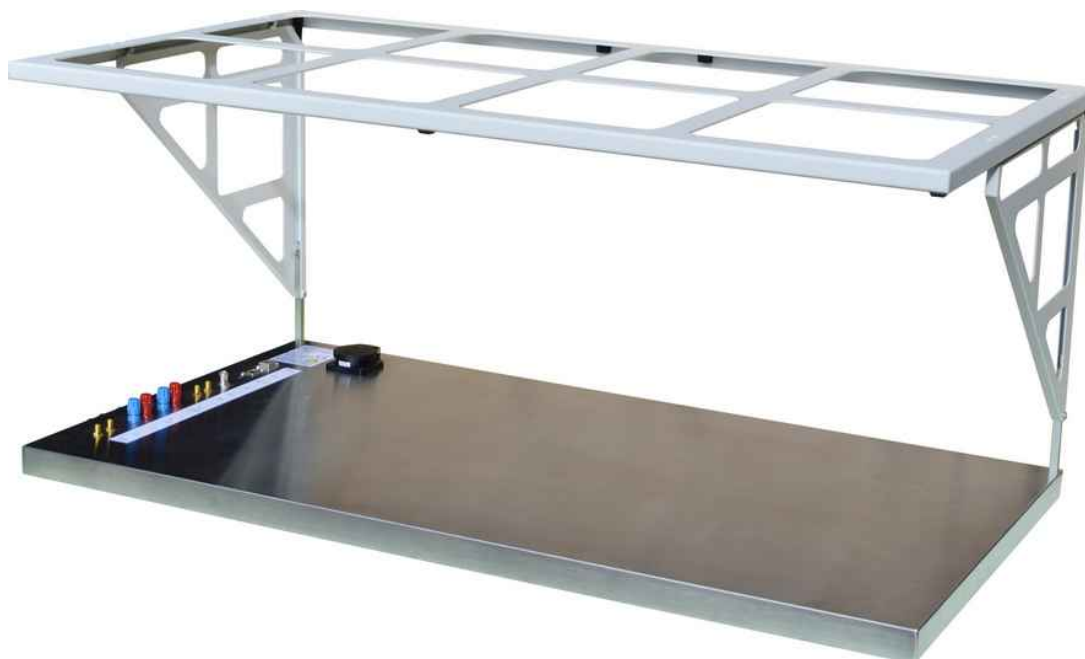
Grundplatte mit Zeltgestänge aufgebaut